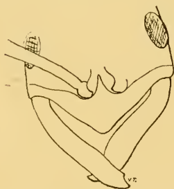
Leptogenys incisa , For. var. antongilensis , Emery. ♀ Parte anteriore del corpo.

♀ In questa forma, le mandibole hanno, come nel tipo, un piccolo dente subapicale, ma (come mi scrive il prof. Forel cui ho comunicato un esemplare) essa differisce dal tipo stesso per le mandibole più larghe, il capo più allungato e il clipeo più sporgente, con margine pelucido. Del resto simile al tipo.